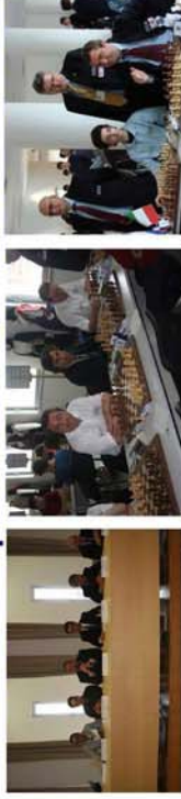
Mitropa Cup Olbia